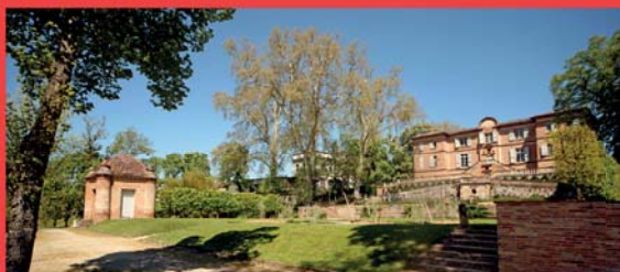
Musée des Beaux-Arts de la Ville de Gaillac dans le parc de Foucaud

L'exposition, à travers les thématiques de la calligraphie, des paysages, de la présence humaine dans le paysage et de l'évocation de l'univers de la nature...s'attache à montrer comment cet art s'inscrivait dans un univers intellectuel très riche où la philosophie, la religion et la culture occupaient une place essentielle.